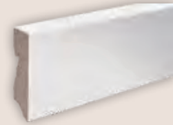
Art.-Nr. 70420 WEISS FOLIERT passend zu allen Böden