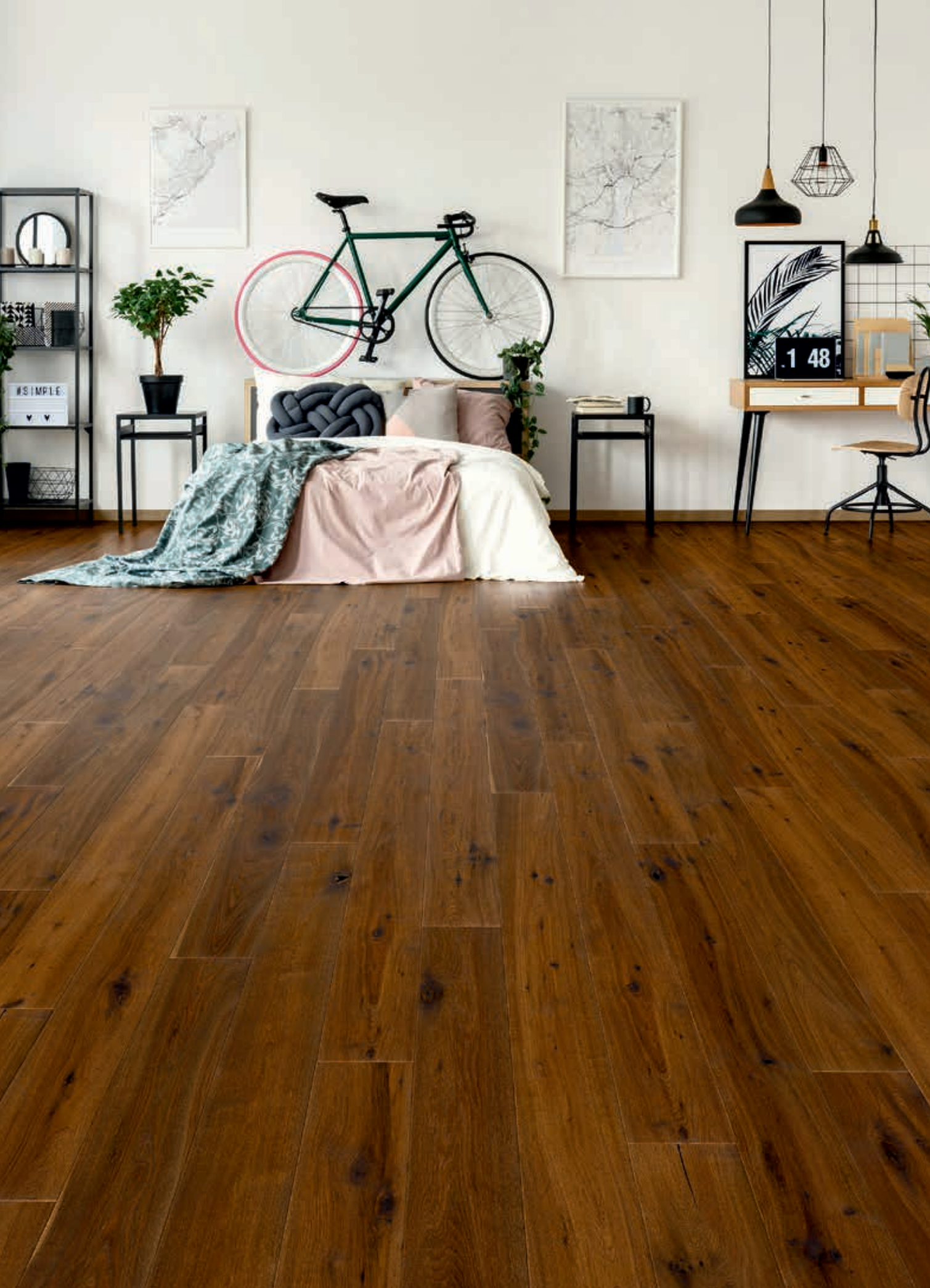
LANDHAUSDIELE COUNTRY | Art.-Nr. 50163 Eiche, country, angeräuchert, gealtert, natur-geölt