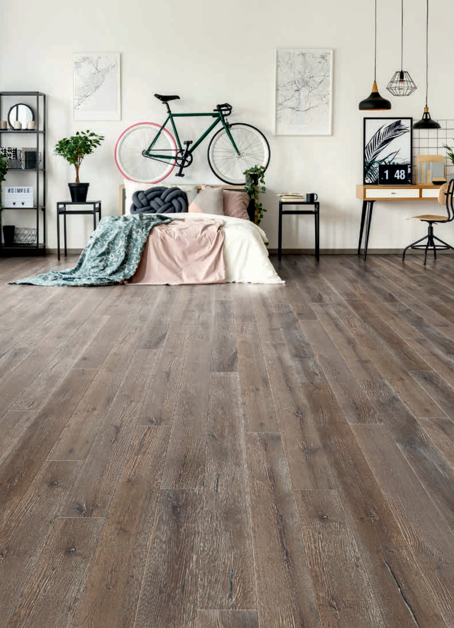
LANDHAUSDIELE URIG | Art.-Nr. 50221 Eiche, urig, angeräuchert, gebürstet, white grain, uv-geölt