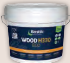
Art.-Nr. 70050 BOSTIK WOOD H330 ECO KLEBSTOFF Lösemittelfreier Einkompo- nenten Klebstoff für die elastische Verklebung von Mosaikparkett und Mehr- schichtparkett bis 250 cm Dielenlänge. Verbrauch mit B11 = 1000-1200 g/m 2 . Eimer à 17 kg = ausreichend für ca. 14-17 m 2