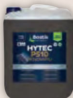
Art.-Nr. 70057 BOSTIK HYTEC P510 RENORAPID Haft- und Grundierungsdis- persion zur Vorbereitung des Untergrundes. Für saugfähige und nicht saugfähige Unter- gründe. Roll- und streichfähig. Verbrauch: als Grundierung: ca. 150 g/m 2 , als Feuchtig- keitssperre: ca. 250-300 g/m 2 . Kanister à 11 kg = ausreichend für ca. 44 m 2