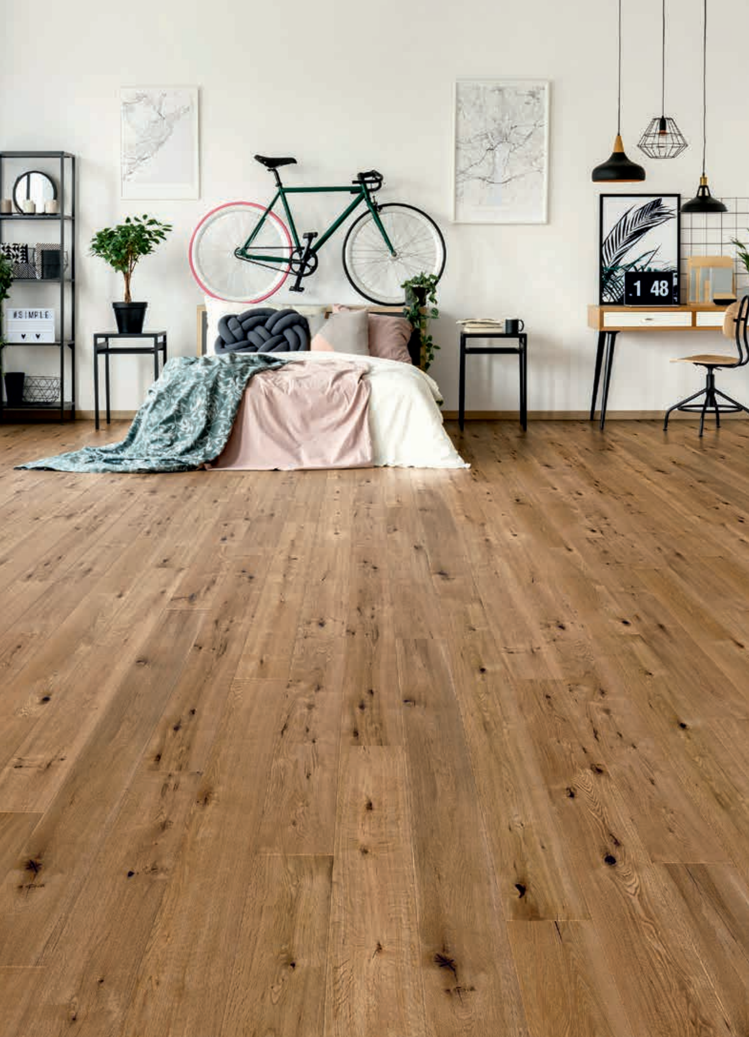
LANDHAUSDIELE COUNTRY | Art.-Nr. 50150 Eiche, country, handgehobelt, natur-geölt