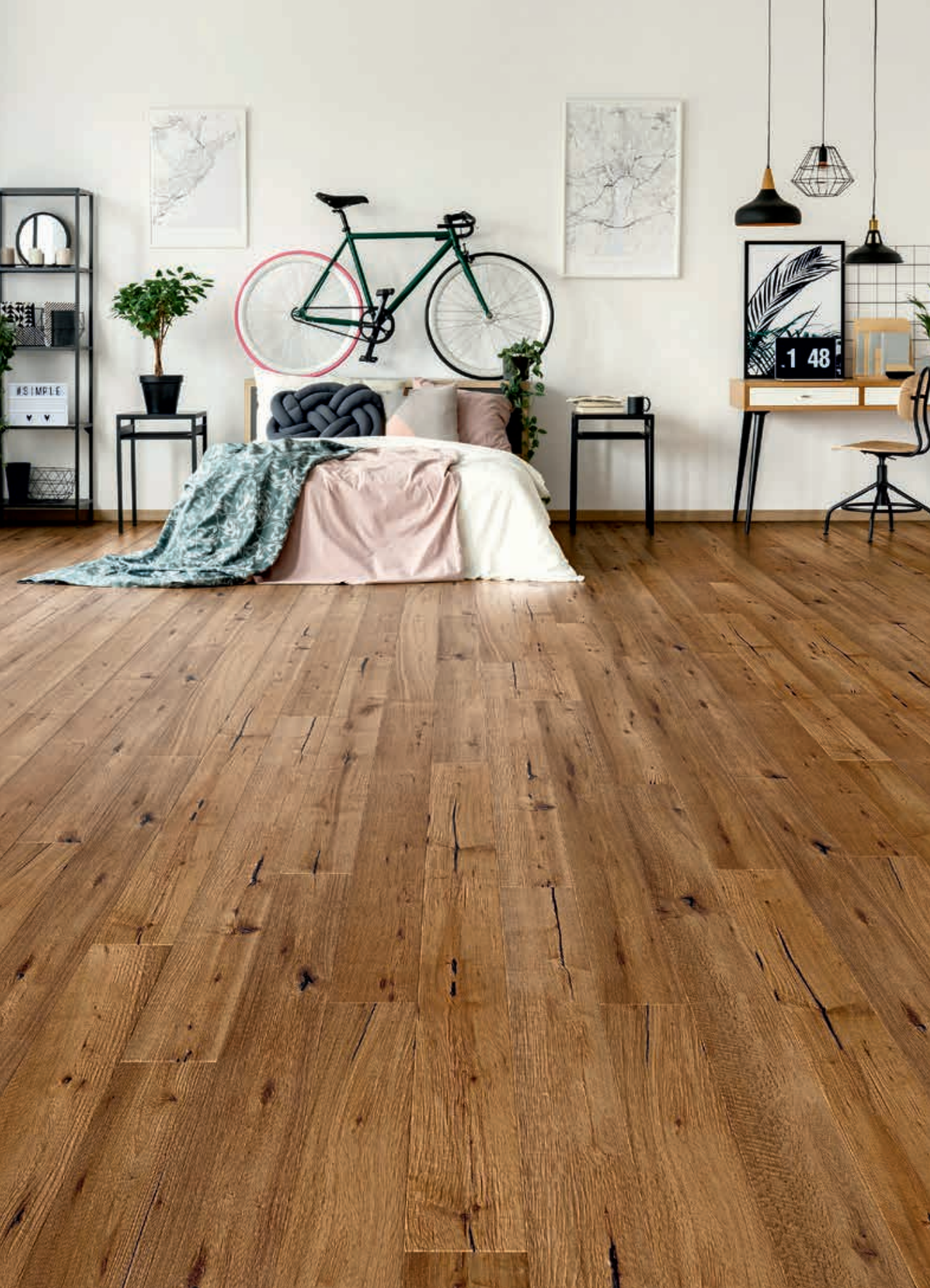
LANDHAUSDIELE URIG | Art.-Nr. 50219 Eiche, urig, angeräuchert, gebürstet, uv-geölt