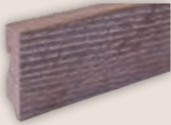
Art.-Nr. 70405 EICHE MOCCA- BRAUN GEKÄLKT passend zu Art.Nr. 50223

16 x 58 x 2400 mm, furniert. VPE: 5 Leisten