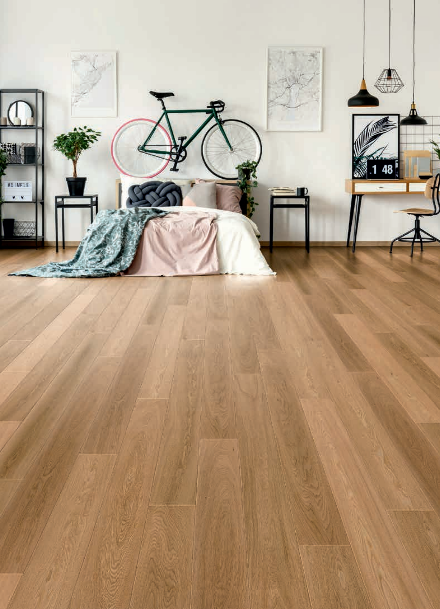
LANDHAUSDIELE NATUR | Art.-Nr. 50130 Eiche, natur, gebürstet, natur-geölt