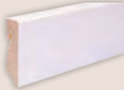
Art.-Nr. 70406 WEISS LACKIERT passend zu allen Böden