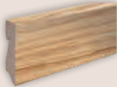
Art.-Nr. 70410 EICHE FARBLOS GEÖLT passend zu Art.Nr. 50102, 50105, 50107, 50130, 50148, 50150, 50154, 50156, 50160, 50163, 50170, 50184, 50190, 50191, 50201, 50203, 50227