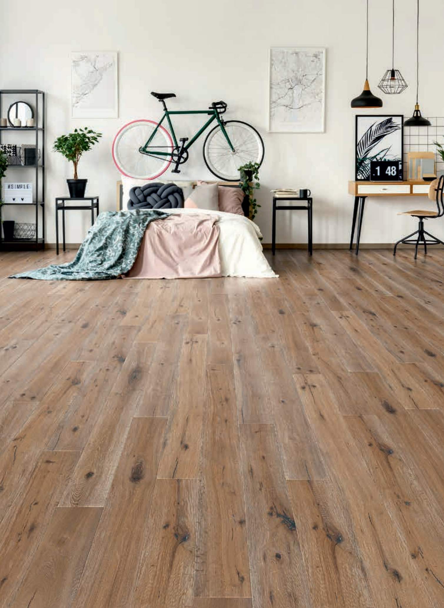
LANDHAUSDIELE URIG | Art.-Nr. 50223 Eiche, urig, angeräuchert, gehobelte Äste, gebürstet, white grain, weiß uv-geölt