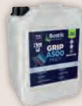
Art.-Nr. 70058 BOSTIK GRIP A500 MULTI Haft- und Grundierungsdispersion zur Vorbereitung des Untergrundes, als Haftbrücke, lösemittelfrei, wasser verdünnbar. Verarbeitung: 1:1 wasser verdünnt. Auf stark saugenden, zementären Unter- gründen bis 1:3 wasser verdünnt. Verbrauch: 75 g Konzentrat je m 2 . Kanister à 3 kg = ausreichend für ca. 40 m 2