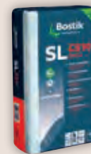
Art.-Nr. 70053 BOSTIK SL C510 PRO dient im Innenbereich zum Spachteln, Ausgleichen und Nivellieren von Estrichen und Schnellestrichen und Rohbe- tondecken. Spannungsarm, selbstverlaufend, streckbar. Verbrauch: ca. 1,5 kg je m 2 je 1 mm Schichtdicke. Sack à 25 kg