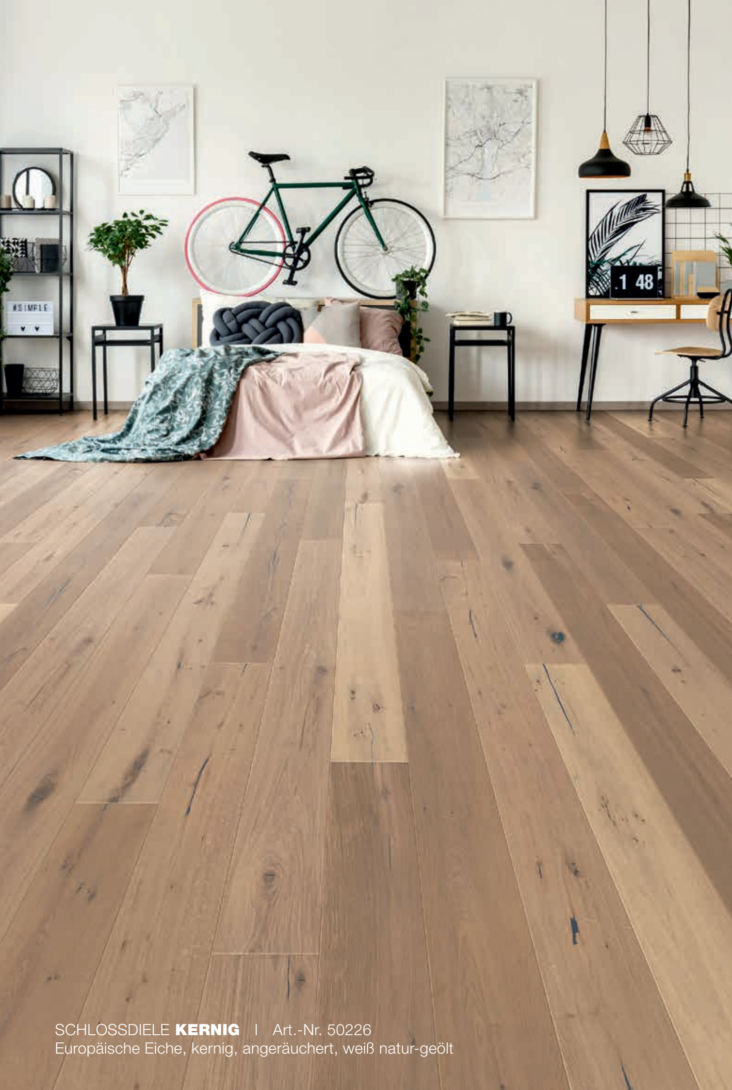
SCHLOSSDIELE KERNIG | Art.-Nr. 50226 Europäische Eiche, kernig, angeräuchert, weiß natur-geölt