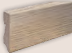
Art.-Nr. 70411 EICHE WEISS GEÖLT passend zu Art.Nr. 50108, 50109, 50131, 50132, 50149, 50158, 50186, 50192, 50193, 50200, 50202, 50228, 50230