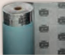
Art.-Nr. 70608 TRITTSCHALL- DÄMMUNG für Parkett mit Dampfsperre, 3 in 1 (Unterlage + Folie + Klebeband), 2 mm stark, 8 m x 1 m (Rolle 8 m 2 ) VPE: 1 Rolle